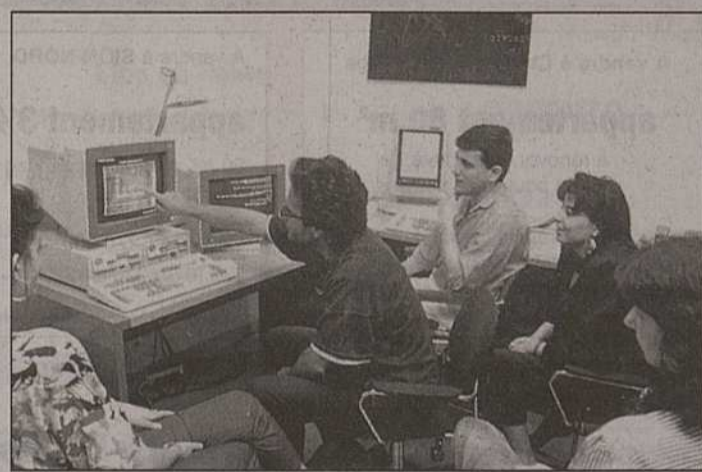
La pénurie d'informaticiens menace la Suisse. Pour réagir, le Valais double son offre de places de formation.

En attendant l'ouverture de la nouvelle école de la plaine Bellevue, si tout va bien dans deux ans, six nouvelles classes seront ouvertes sur le site de Technopôle, dans le bâtiment Vulcain, qui sera terminé dans un mois. Ce sont cinq