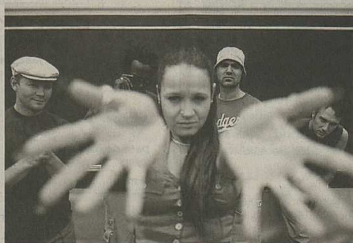
Le groupe Sens Unik sera à la Fête de la jeunesse de Viège, samedi 15 juin prochain.

seront gratuits pour tous les jeunes et, sur place, les prix resteront modiques grâce au parrainage.